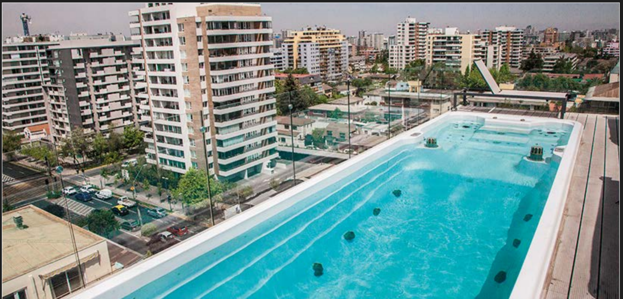
Piscina tipo Jacuzzi con nado contracorriente.