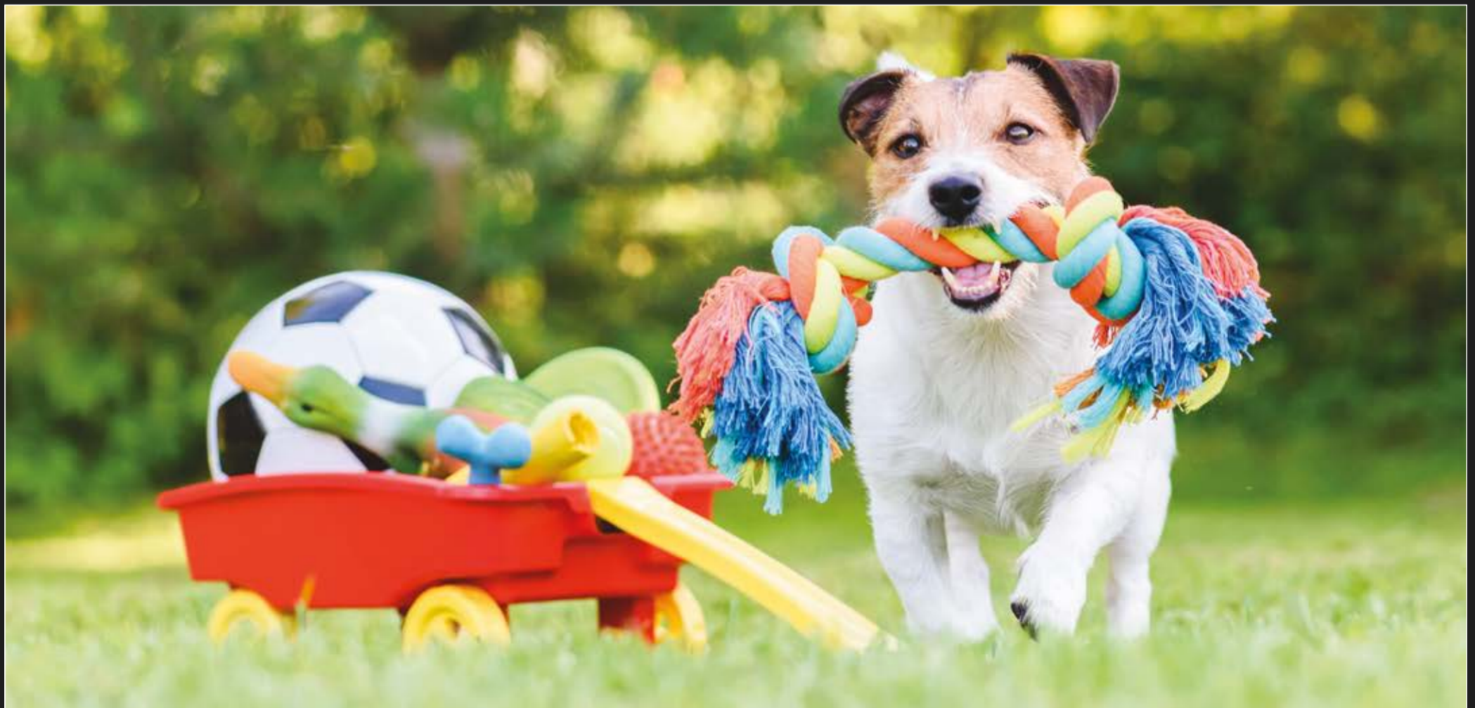
Pet Zone, Zona de juegos para tu mascota.