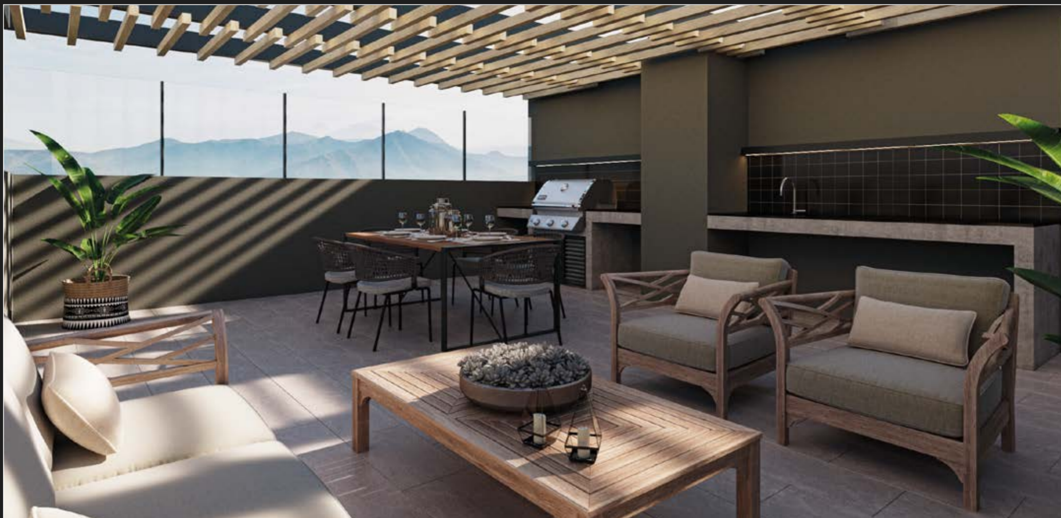
Espectacular Quincho Mirador .