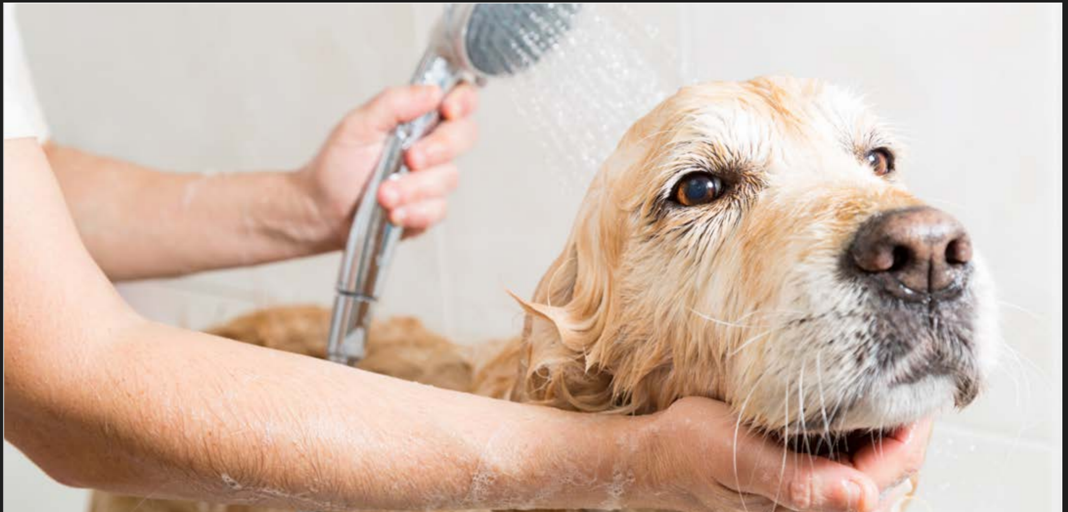
Pet Spa, Sala especialmente equipada para los cuidados de tu mascota.