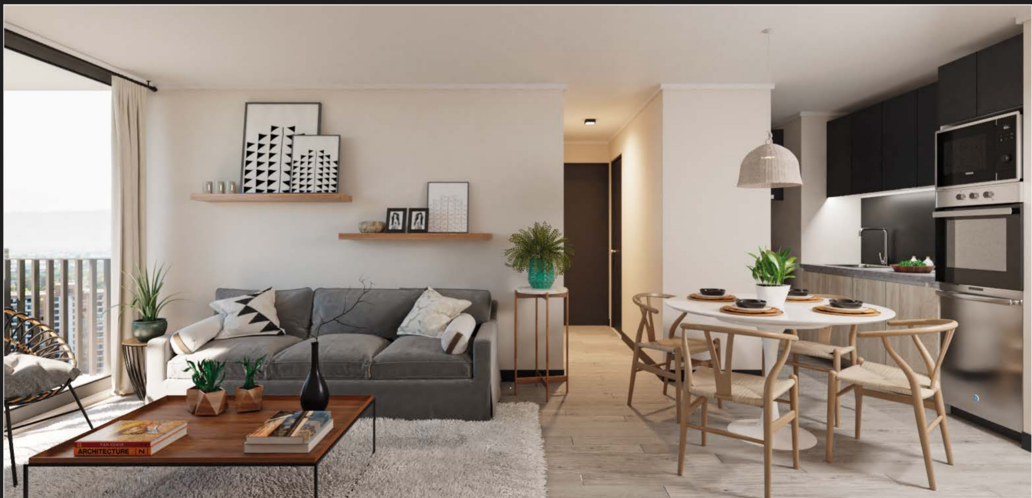
Piso vinílico contra agua y atenuador de sonido • Cocina con cubierta de granito • Cocina equipada con: Campana, Cocina encimera vitrocerámica, Horno eléctrico y Horno Microondas.