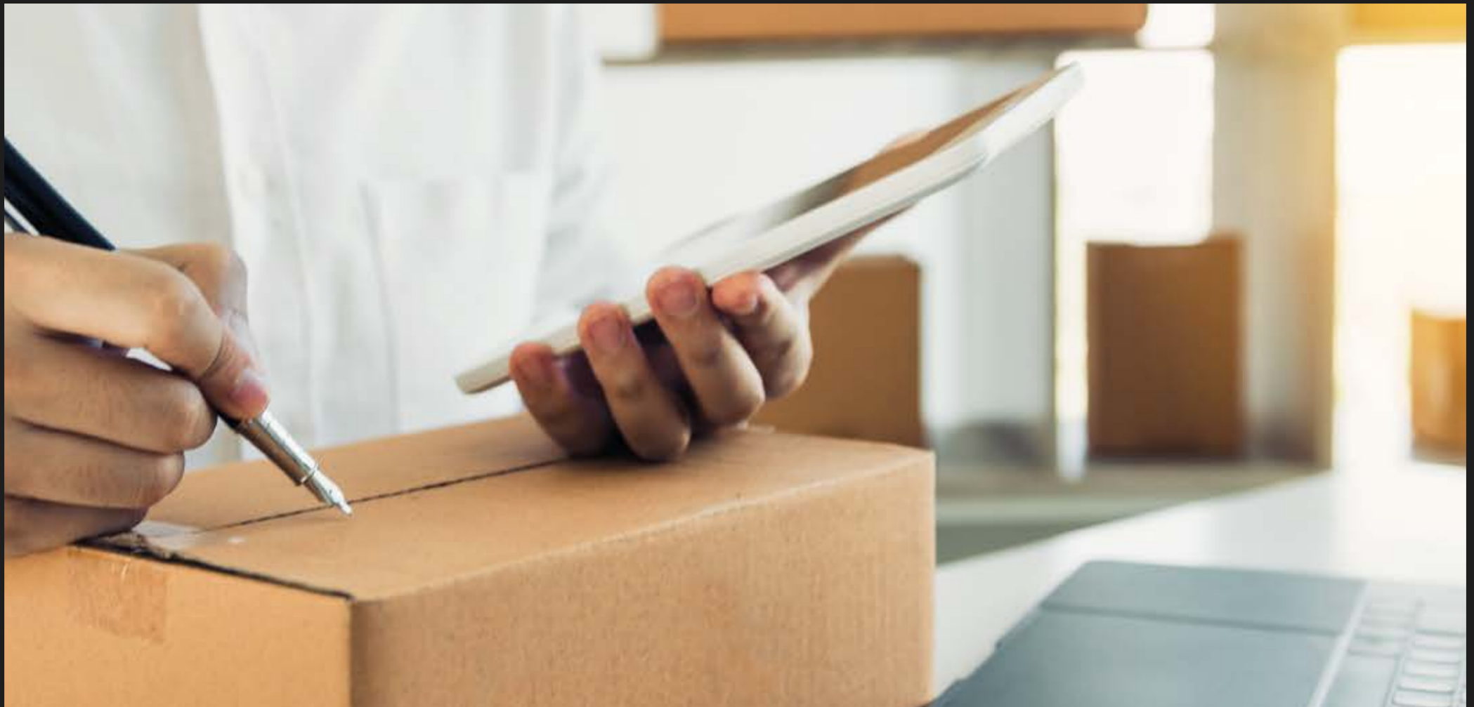
Sala de Ecommerce con refrigeradores, para guardar todas tus compras online mientras estés ausente.