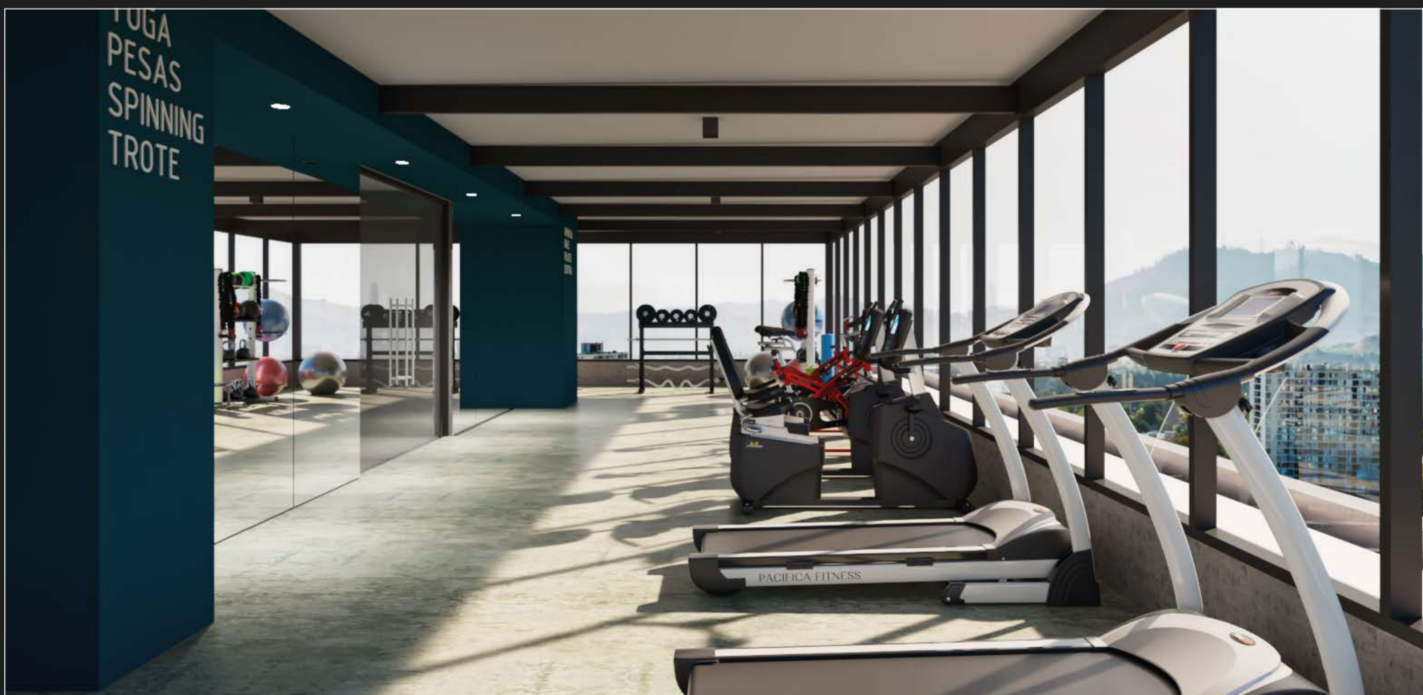
Gimnasio Panorámico en piso 12, equipado con aplicación para entrenamiento asistido.