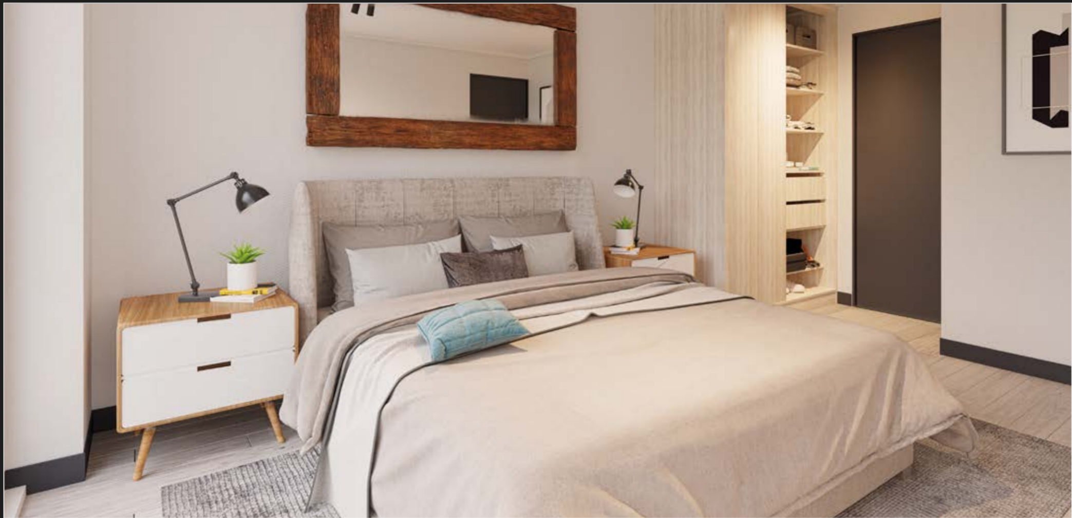
Ventanas de PVC blanco con termopanel